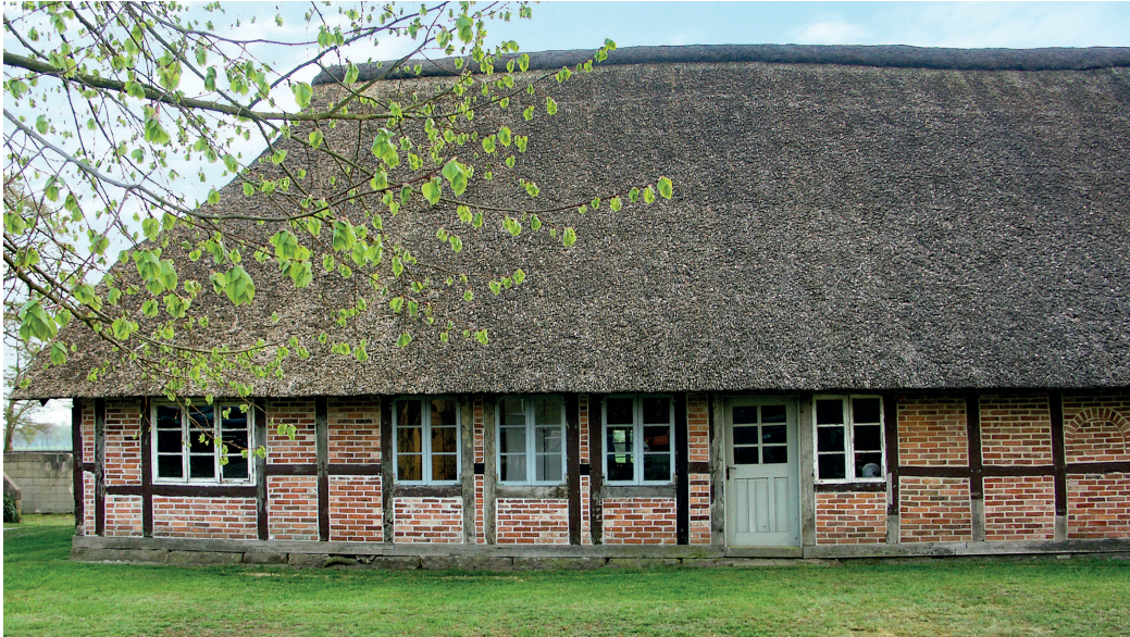
1 Traufseite des Kammerfachs von Eckes Hus; Ansicht von Norden, 2015

Eckes Hus ist das älteste Bauernhaus des Landkreises Rotenburg (Wümme) und seit zweieinhalb Jahrzehnten ein Projekt der dortigen IGB-Außenstelle. Nachdem 1994 ein Abrissantrag gestellt war, hatten sich Mitglieder unserer Außenstelle zu einer Rettungssanierung entschlossen, die den Erhalt und die denkmalgerechte Präsentation des Hauses zum alleinigen Ziel hatte. Diese Arbeiten sollen jetzt nach einer dreijährigen Pause weitergehen – ja, eigentlich ist so etwas wie ein Abschluss unserer Arbeiten vorgesehen. Dazu gehört im Wesentlichen die Sanierung des letzten noch desolaten Raumes im Kammerfach und des „Schüttbodens“ über den Räumen des Kammerfachs. Dafür sind bereits die Förderanträge geschrieben und sollen, falls die Zuschüsse aus den in Ostereistedt laufenden Dorferneuerungs-