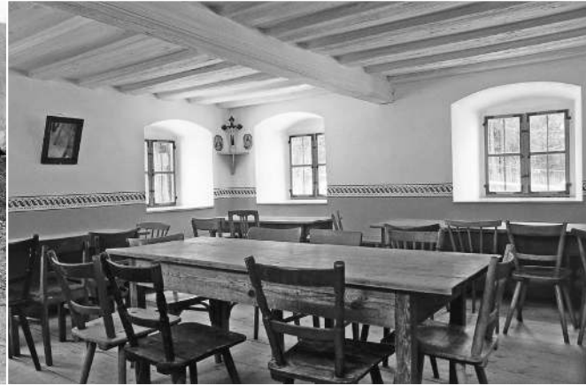
6 Gaststube des Wirtshauses Unterbürg mit großen Fenstern

Regenzeit wegen der verschiedenen unreinen Dünste, welche der Regen aus der Atmosphäre mit zur Erdoberfläche herabführt, einen etwas unangenehmen Geschmack hat.“ Sowohl Haus als auch Backhaus ist mit dem charakteristischen Plattenkalk gedeckt.