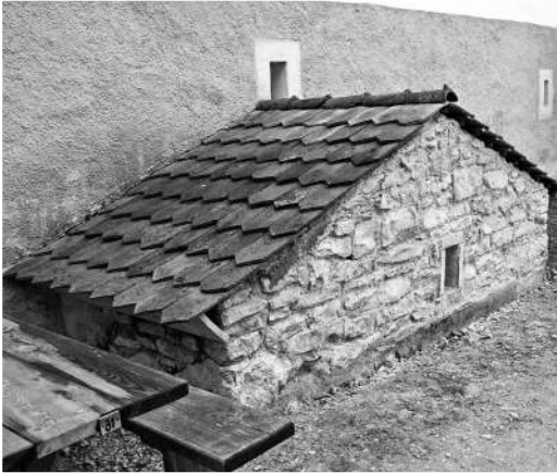
5 Heutiger Keller des Wirtshauses Unterbürg: An dieser Traufseite war Ende des 19. Jh. ein Stall angebaut.