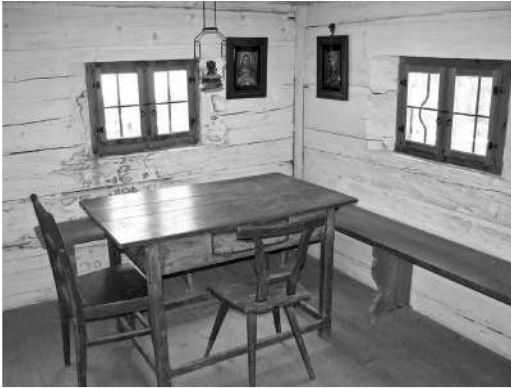
3 Stube des Hüthaus Thonlohe, Zeitstellung 1890